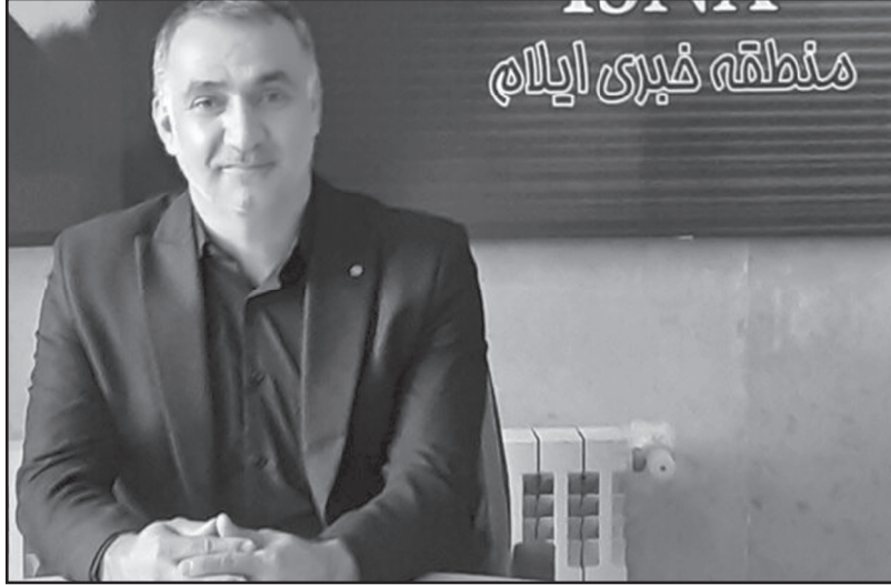
به دست زائران برسانیم، افزود: علاوه

مدیر کل ستاد اجرایی فرمان حضرت امام خمینی (ره)، ایلام با اشاره به اینکه پیش بینی میشود حجم عظیمی از زائران از مرز مهران تردد کنند لذا می طلبد همه دستگاه ها با تمام توان پای کار باشند، خاطرنشان کرد: اگر به درستی اقدامات و فعالیت ها پیش بینی شده برای اربعین پیش نرود قطعاً دچار مشکل خواهیم شد. وی تصریح کرد: در ایام اربعین آب شرب پایانه مرزی مهران توسط ستاد اجرایی تامین و در اختیار زائران قرار می گیرد.